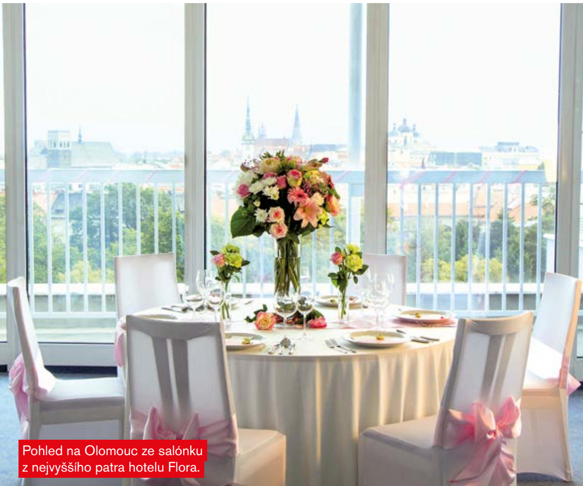
Pohled na Olomouc ze salónku z nejvyššího patra hotelu Flora.