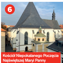
Kościół Niepokalanego Poczęcia Najświętszej Marii Panny