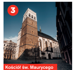
Kościół św. Maurycego