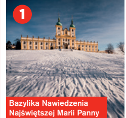
Bazylika Nawiedzenia Najświętszej Marii Panny