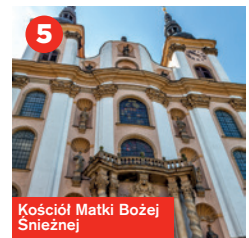
Kościół Matki Bożej Snieżnej