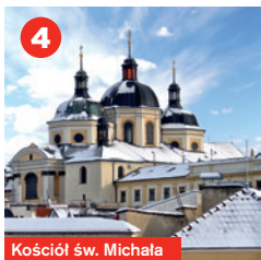
Kościół św. Michała