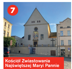
Kościół Zwiastowania Najświętszej Marii Pannie