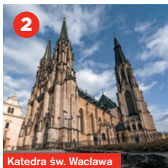
Katedra św. Wacława