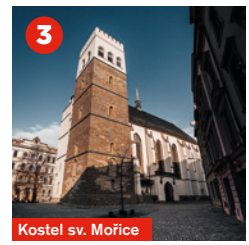
Kostel sv. Mořice