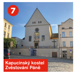
Kapucínský Kostel Zvěstování Páně