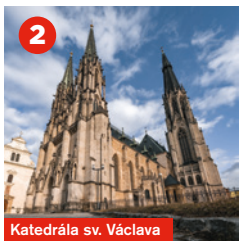
Katedrála sv. Václava