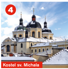
Kostel sv. Michala