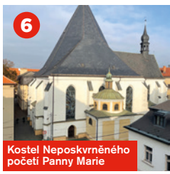
Kostel Neposkvrněného početí Panny Marie