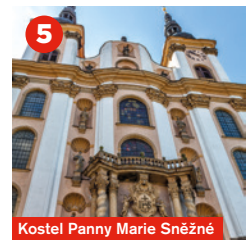
Kostel Panny Marie Sněžné