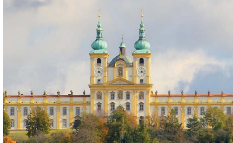
Kościół Nawiedzenia Marii Panny, bazylika mniejsza

Ze względu na wzrastającą liczbę pielgrzymów norbertanie z Hradiska wybudowali w latach 1669–1679 nowy, przestronny kościół według projektu słynnego architekta G. P. Tencalli. Do obecnego kształtu świątynię rozbudowano w latach 1714–1721 według projektu D. Martinello. Wybudowano wówczas rezydencję, a kompleks rozszerzono o krużganek i kaplicę pw. Imienia Marii Panny. Fasada kościoła w połączeniu ze skrzydłami bocznymi tworzy bardzo pociągającą architektonicznie całość. Figury są dziełem J. Winterhladera, który wraz ze swym bratem stworzył również figurę św. Norberta pośrodku krużganka za kościołem. We wnękach fasady umieszczono figury Marii Panny z Dzieciątkiem, św. Szczepana, św. Augustyna i św. Norberta. Nad poziomym gzymsem obu skrzydeł budynku postawiono figury dwunastu apostołów oraz św. Sebastiana i św. Rocha, chroniących wiernych od zarazy.