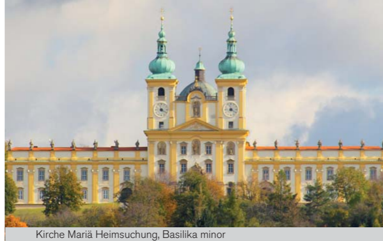
Kirche Mariä Heimsuchung, Basilika minor

Die Prämonstratenser von Hradisko erbauten hier in den Jahren 1669–1679 nach dem Entwurf des berühmten Architekten G. P. Tencalla eine neue, geräumige Kirche für die wachsende Zahl der Pilger. Das Areal wurde in seiner heutigen Gestalt in den Jahren 1714–1721 nach dem Projekt von D. Martinelli fertig gestellt. Es wurde eine Residenz erbaut und der Komplex wurde um einen Kreuzgang und die Kapelle Mariä Namen erweitert.