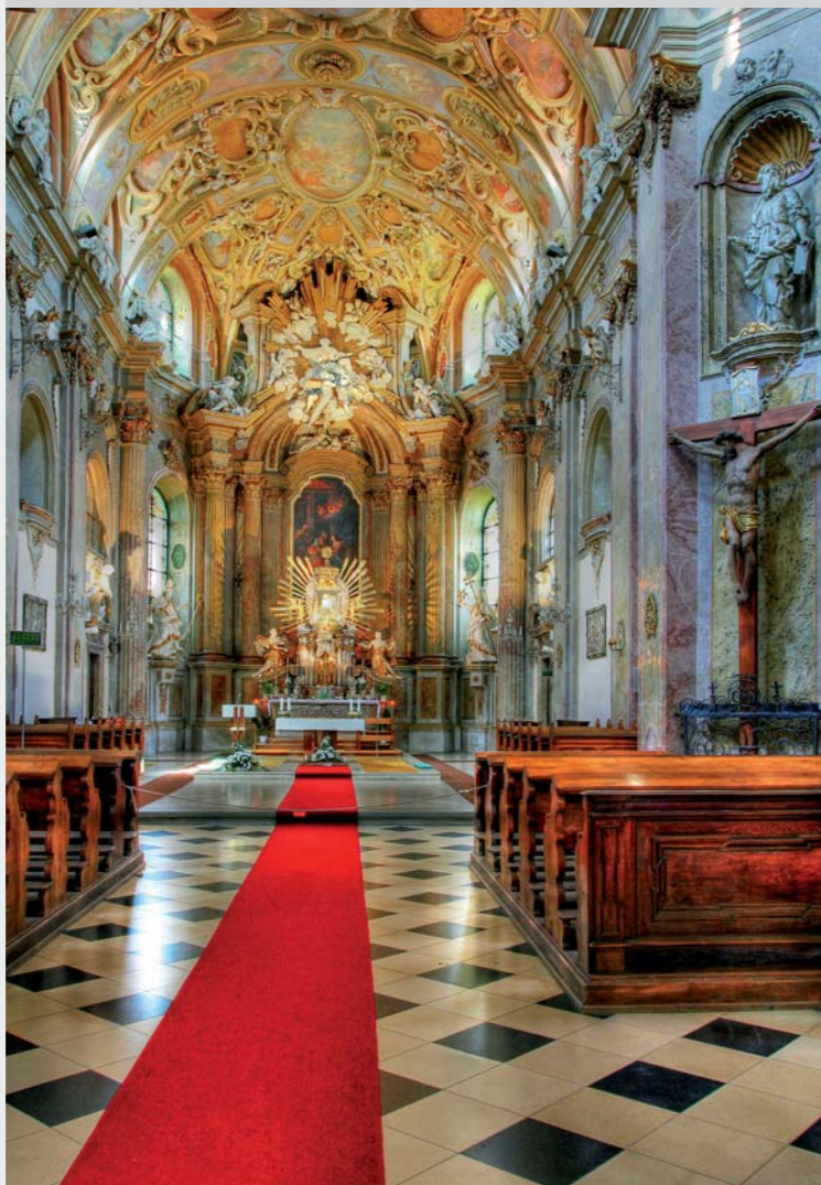
Interieur der Kirche