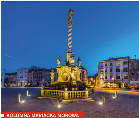
KOLUMNNA MARIACKA MOROWA

Ołomuńcu (1713–1715) z inicjatywy kamieniarza Wacława Rendra Dolną część z owalnym otworem pośrodku zdobią posągi ośmiu świętych – patronów chroniących miasto przed morem.