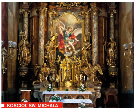
KOŚCIÓŁ ŚW. MICHAŁA

Wczesnobarokowy kościół świętego Michała został wzniesiony w miejscu pierwotnej gotyckiej świątyni według projektu Tencalli i Martinellogo w latach 1676–1702. W XIX wieku na fasadę frontową przeniesiono barokowe rzeźby Chrystusa i Marii Panny z warsztatu rzeźbiarza Ondřeja Zahnera. Imponujące barokowe wnętrze kościoła, należące do najpiękniejszych w Ołomuńcu, zostało częściowo odrestaurowane w duchu historyzmu w 1897 roku i ostro kontrastuje z surową fasadą.