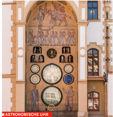
■ ASTRONOMISCHE UHR

Der Caesar-Brunnen ist der bekannteste und künstlerisch anspruchsvollste Olmützer Brunnen. Seine bildhauerische Verzierung stellt den sagenhaften Gründer der Stadt – Kaiser Gaius Iulius