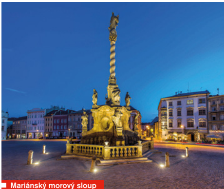
Mariánský morový sloup