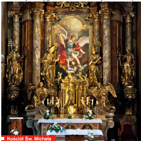
Kościół Św. Michała

Wczesnobarokowy kościół św. Michała został zbudowany na miejscu pierwotnego gotyckiego kościoła zaprojektowanego przez Tencallę i Martinellogo w latach 1676-1702. W XIX wieku na fasadę frontową przeniesiono barokowe posągi Chrystusa i Marii Panny z warsztatu rzeźbiarza Ondřeja Zahnera. Imponujące barokowe wnętrze kościoła, jedno z najpiękniejszych w Ołomuńcu, zostało częściowo odrestaurowane w duchu historyzmu w 1897 roku i ostro kontrastuje z surowym wyglądem zewnętrznym. Dostępna