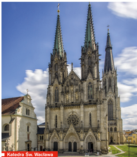
Katedra Św. Wacława

mierząca 100,65 m, jest najwyższą na Morawach. Pierwotnie romańska bazylika została poświęcona w 1131 roku przez biskupa Jindřicha Zdíka. Po pożarach w XIII i XIV wieku została odbudowana jako gotycka trójnawowa, z renesansową kaplicą św. Stanisława po południowej stronie. Pod XVII-wiecznym prezbiterium znajduje się dwukondygnacyjna krypta: górna kondygnacja służy jako przestrzeń wystawiennicza, a w dolnej można zobaczyć trumny biskupów ołomunieckich. Na ołtarzu przy jednym z filarów znajduje się relikwiarz z relikwiami św. Jana Sarkandra, kanonizowanego przez papieża Jana Pawła II w Ołomuńcu w 1995 roku. W latach 1883-1891 katedra przeszła neogotycką rekonstrukcję zaprojektowaną przez Gustava Merette.