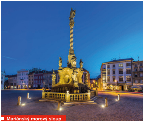
Mariánský morový sloup