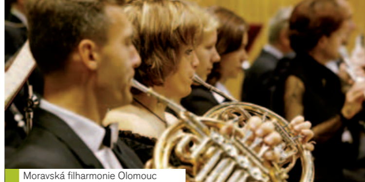
Moravská filharmonie Olomouc

www.kasparkovarise.webnode.cz | tel.: 585 417 966