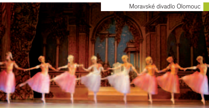
Moravské divadlo Olomouc

www.moravskedivadlo.cz | tel.: 585 500 500