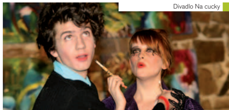
Divadlo Na cucky