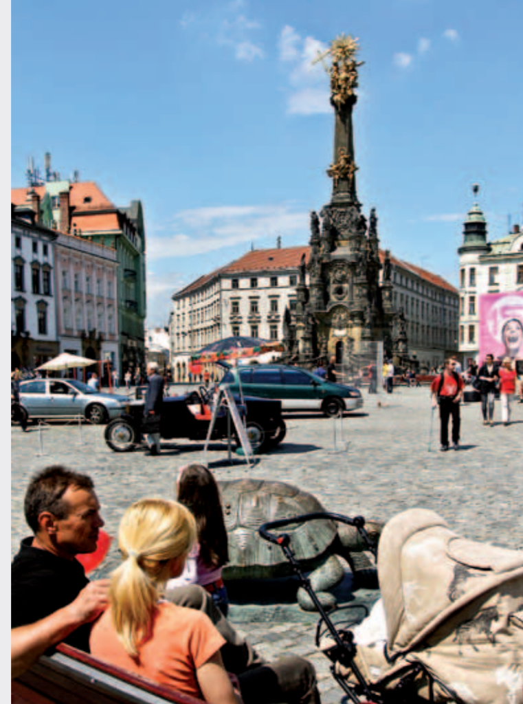
Вы знаете, что...

Оломоуц - это один из городов, где много безбарьерных входов в музеи, гостиницы, рестораны, поэтому при их посещении не возникнет проблем у родителей с колясками.