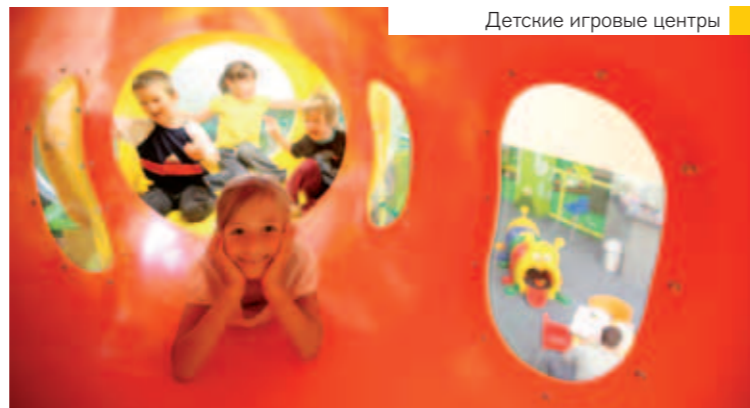
Детские игровые центры

круглый год воскр. – чтв. 14:00–22:00 пятн. и суб. 14:00–24:00