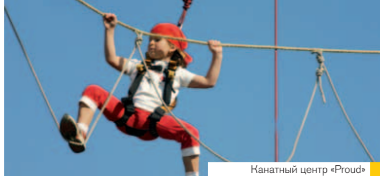
Канатный центр «Proud»

Любители адреналина, не пройдите мимо! Вам наверняка понравится преодоление оригинальных канатных препятствий различного уровня сложности на высоте 8 метров над землей. Каждый, кто попробует побороть свой страх и преодолеть препятствия, подстрахован альпинистской страховкой. Для детей – препятствия на небольшой высоте над землей. | www.lanovecentrum.cz