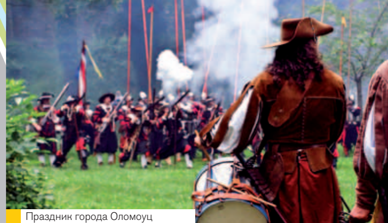
Праздник города Оломоуц