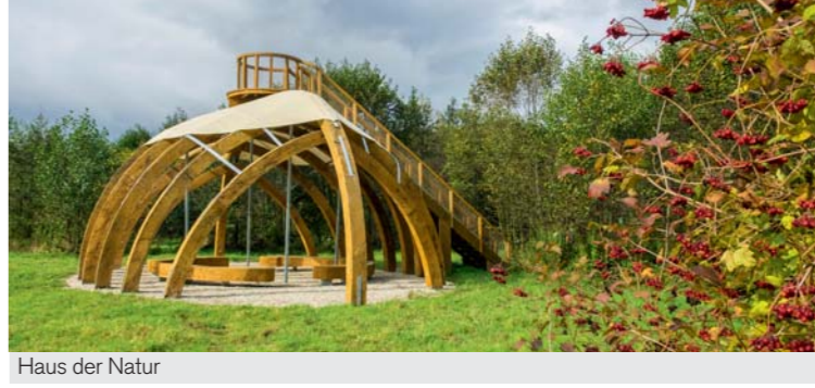
Haus der Natur