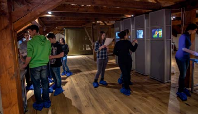
Festung des Wissens

Auch der gotische Glockenturm, der Kreuzgang mit einer Bildersammlung des Barockmalers Ignaz Raab und eine unterirdische Einsiedelei mit einem Brunnen sind öffentlich zugänglich. In den Sommermonaten kann man sich mit den Kindern in der Mitte des Kreuzgangs im St. Michael-Garten, der mit Klettergerüsten und Schaukeln ausgestattet ist, erholen.