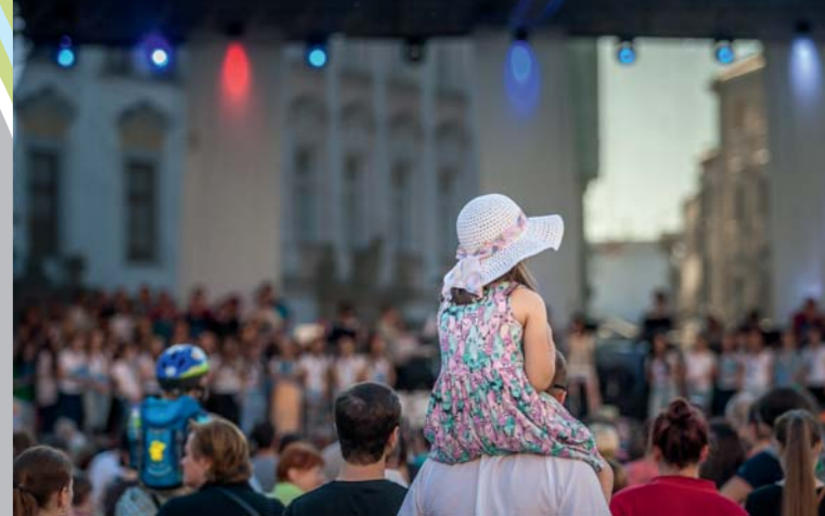
Tag des Europäischen Kulturerbes

Kulturtipps Für die Kleinsten gibt es regelmäßige Aufführungen des Puppentheaters Kasperreich, Theater Tramtarie und sonntägliche Aufführungen im Šantovka Theater. www.divadlonasantovce.cz , www.kasparkovarise.cz , www.divadlonasantovce.cz Mehr Informationen auch unter www.olomouc.eu/culture/calendar-of-events/de .